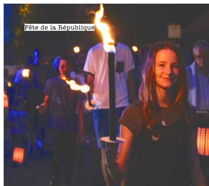
Fête de la République