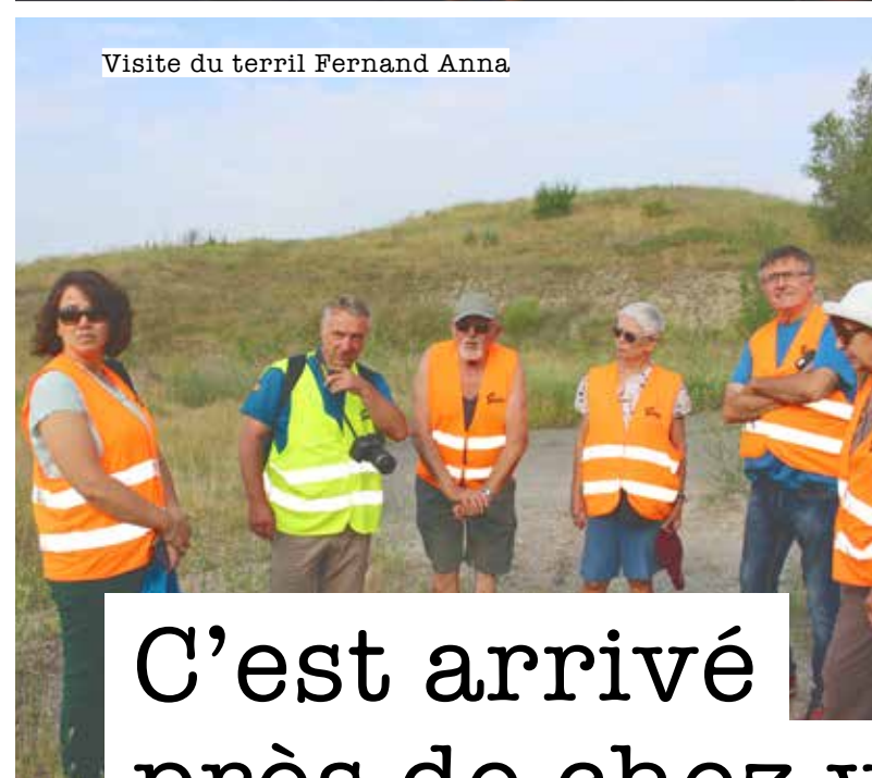
Visite du terril Fernand Anna