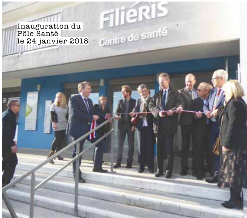
Inauguration du Pôle Santé le 24 janvier 2018