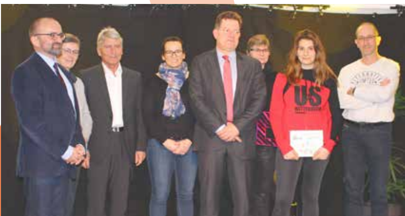
Équipe U15 Élite USW Basket : Trophée OR par équipe