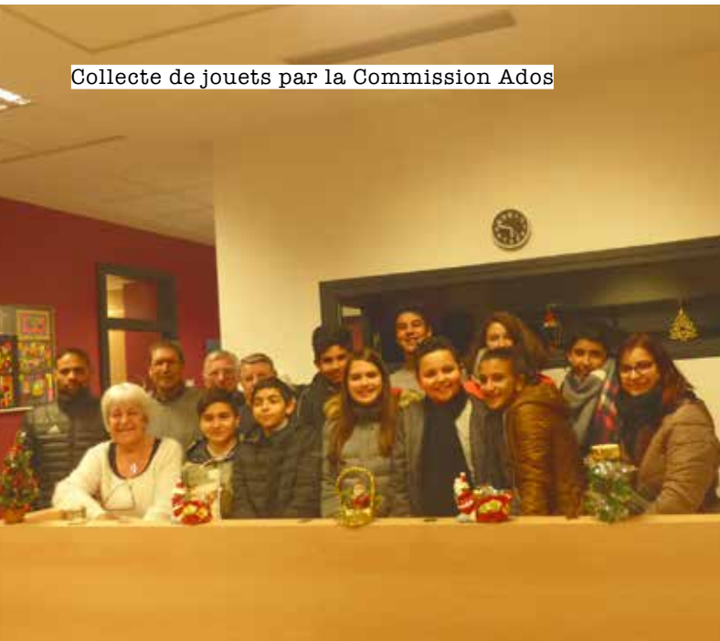
Collecte de jouets par la Commission Ados