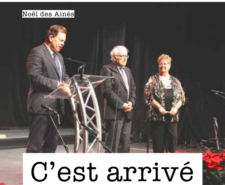
Noël des Aînés