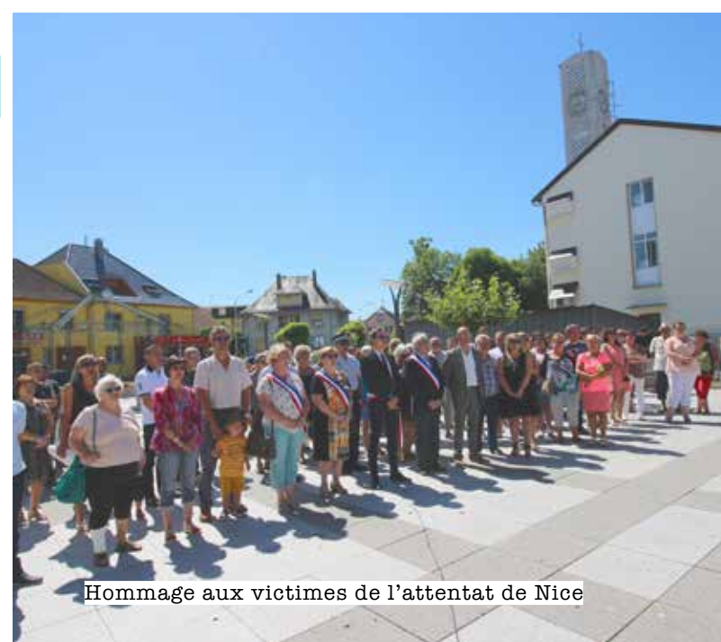
Hommage aux victimes de l'attentat de Nice