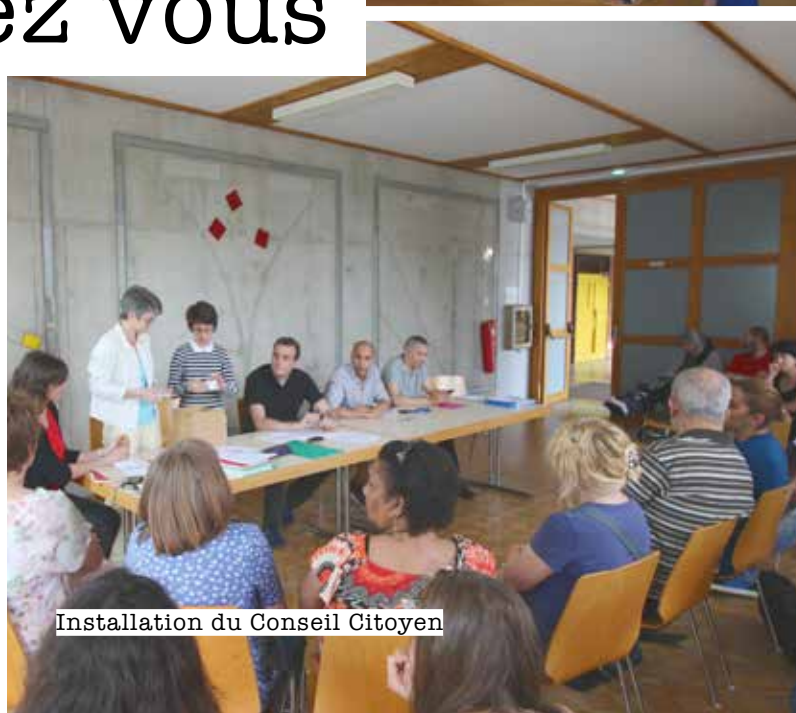
Installation du Conseil Citoyen