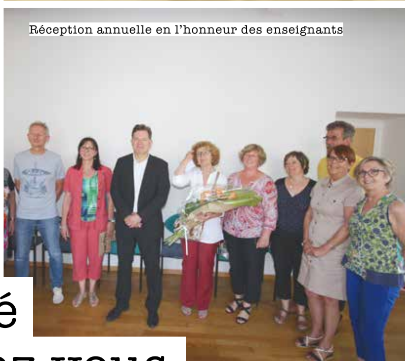
Réception annuelle en l'honneur des enseignants