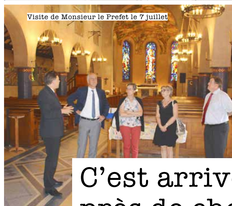
Visite de Monsieur le Prefet le 7 juillet