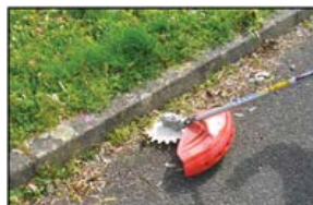
Débroussailleuse sans projection

En tant que citoyen et habitant de Wittenheim, vous pouvez également apporter votre pierre à l'édifice. Voici un schéma pour apprendre à désherber devant votre maison et sur votre terrain sans produit phytosanitaire. C'est simple et vous ferez un geste citoyen pour la planète.