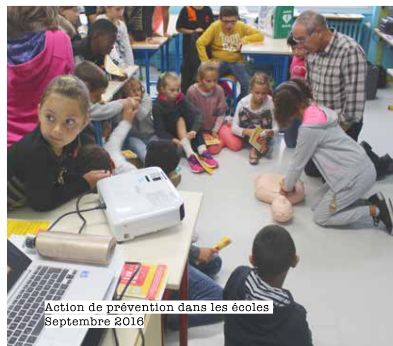
Action de prévention dans les écoles Septembre 2016