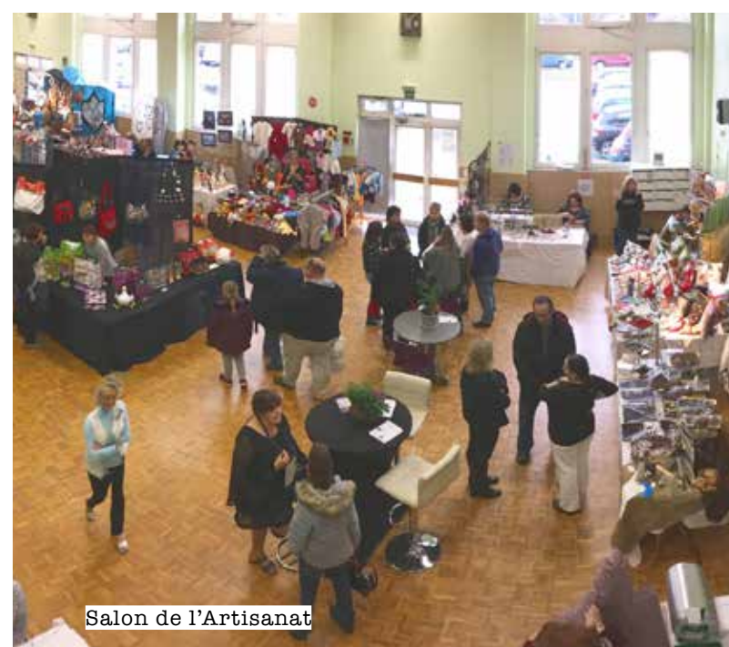
Salon de l'Artisanat