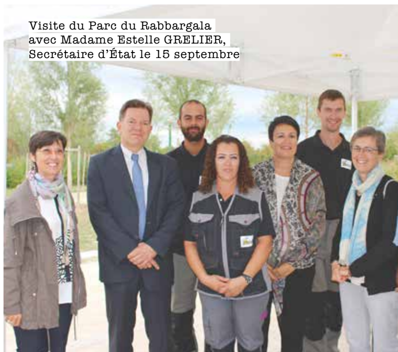
Visite du Parc du Rabbargala avec Madame Estelle GRELIER, Secrétaire d'État le 15 septembre