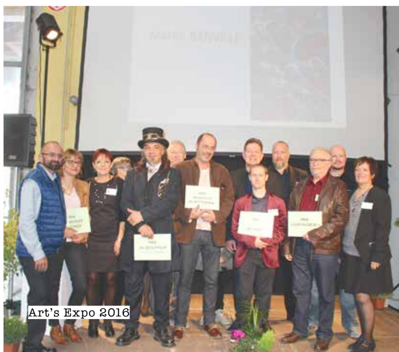
Art's Expo 2016