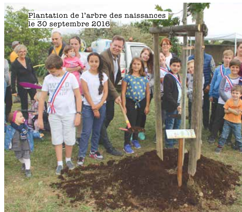
Plantation de l'arbre des naissances le 30 septembre 2016