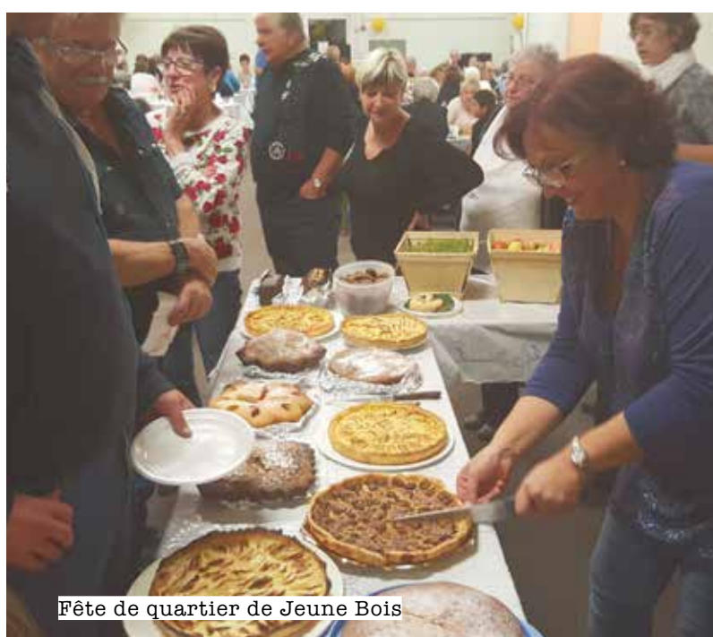
Fête de quartier de Jeune Bois