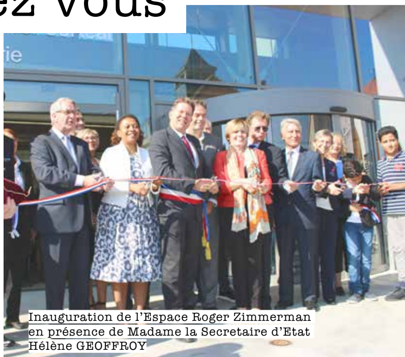
Inauguration de l'Espace Roger Zimmerman en présence de Madame la Secrétaire d'Etat Hélène GEOFFROY