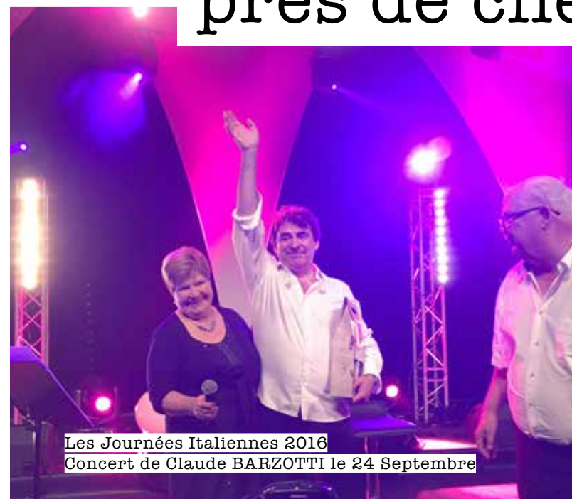
Les Journées Italiennes 2016 Concert de Claude BARZOTTI le 24 Septembre