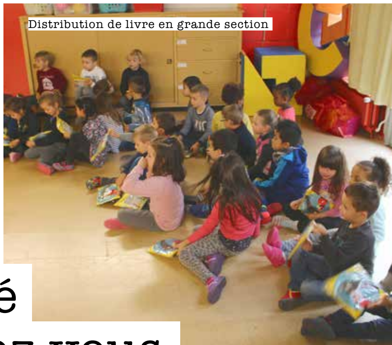
Distribution de livre en grande section