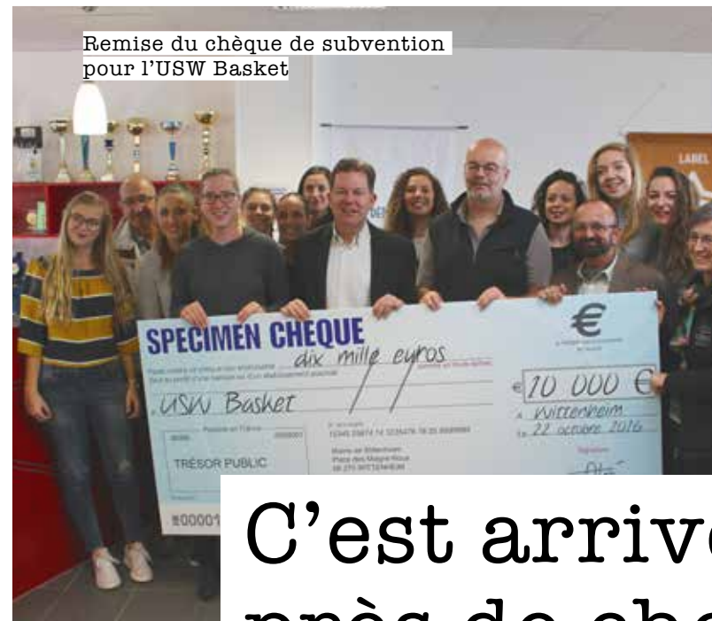
Remise du chèque de subvention pour l'USW Basket