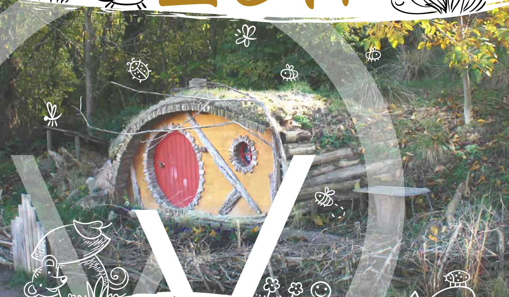
Maison du Hobbit - Parc du Rabbargala